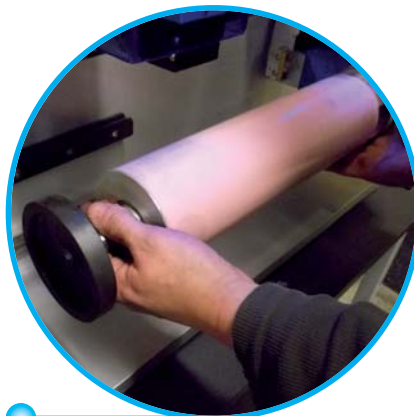
• Mise en place du cylindre.